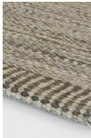
VE 03 Grigio Cenere