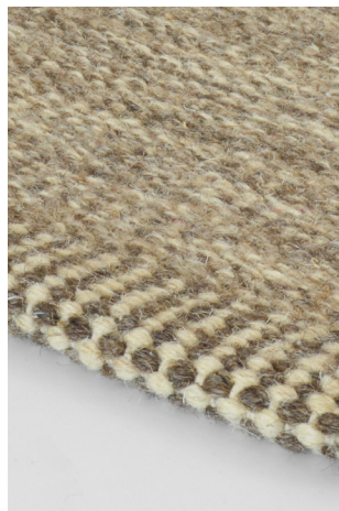
VE 02 Beige